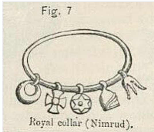
Hexagrama em colar assírio (centro). Símbolo pagão dos tempos da antiga Babilônia.

O hexagrama também foi usado para representar Saturno , que foi identificado como o nome esotérico para "Satã" . Isso indica que qualquer um morto em nome de Israel na verdade é um sacrifício a Satã . Os judeus discordantes que acreditam que o "Menorah", o símbolo judeu mais antigo, deve ser usado, e também lembrar que o hexagrama não é nem um símbolo judeu , mas é claro que como os sionistas de Rothschild (falsos Judeus) usam ele, ele é o que acaba nos Rothschild... quero dizer, sionistas... não, quero dizer bandeira israelense.